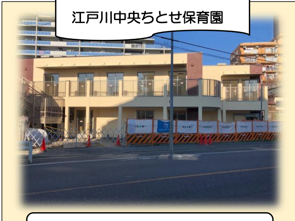
江戸川中央ちとせ保育園