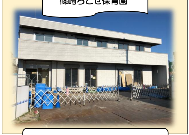
篠崎ちとせ保育園