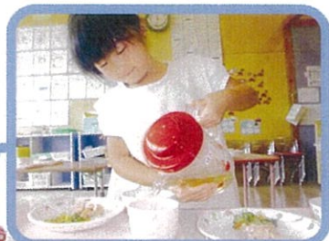
給食の準備は子どもたちで行います。