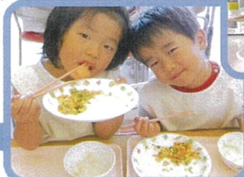
みんなでおいしい給食を食べます。