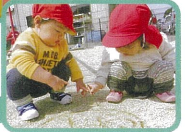
友だちと外で元気に遊びます。