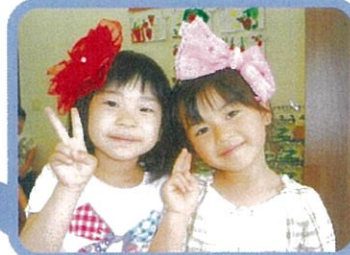
お迎えがくるまで仲良く遊びます。