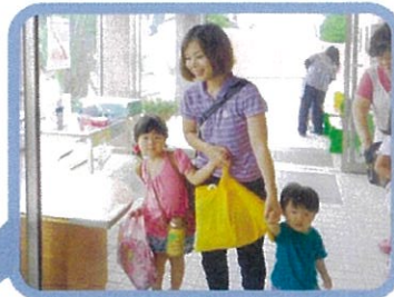
親子で「おはよう」のあいさつで朝がはじまります。