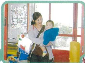
家庭でのしっかりした関わりがあれば1日がんばれます