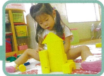
おやつ後も一人てじっくり遊んだり友だちと仲良く遊びながらお迎えを待ちます。